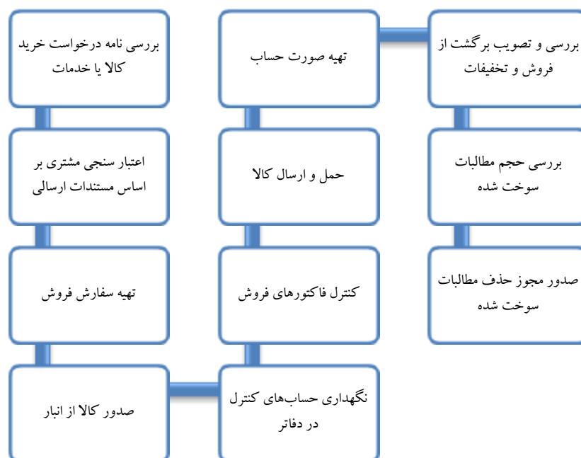
نمودار (۲): فرآیند بررسی صحت شرایط واگذاری حساب‌های دریافتنی

شایان ذکر است از منظر حسابداری نیز ضروریست صحت شرایط حساب‌های دریافتنی به شرح ذیل رعایت گردد: