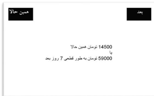
شکل ۱: نمونه‌ای از صفحه انتخاب

به منظور کنترل تأثیر ترتیب آزمایش‌ها نیمی از افراد مورد آزمایش ابتدا آزمایش ترجیحات بین‌زمانی و نیم دیگر ابتدا آزمایش اندازه‌گیری دین‌داری را تکمیل نمودند.