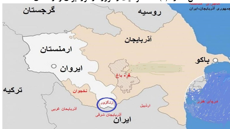
شکل شماره (۲): نقشه موقعیت زنگزور در مرز ایران و ارمنستان

ارتباطی ایران به دریای سیاه و اروپا از طریق خاک ارمنستان و وابستگی ایران به ترکیه و آذربایجان جهت ارتباط با اروپا خواهد شد. پ. عدم احیاء و حذف سوآپ گاز ترکمنستان به ترکیه از مسیر ج.ا.ایران که منجر به کاهش اهمیت و نقش ژئوپلیتیکی ایران خواهد شد.