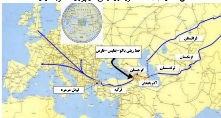
شکل شماره (۱): نقشه کریدور میانی در پروژه کمربند و راه