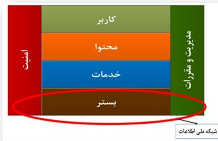
شکل ۱: مدل مفهومی لایه‌ای فضای مجازی (وبسایت مرکز ملی فضای مجازی)

وجود دارد و نه تنها مرزپذیر و قابل کنترل و تحدید نیست، بلکه مرکزی خاص نیز نداشته و به نامتناهی بودن گرایش دارد (فیروزآبادی، ۱۳۹۶، ص. ۱۲). فضای مجازی، در یک مدل لایه‌ای، می‌تواند دارای اجزای زیر باشد: