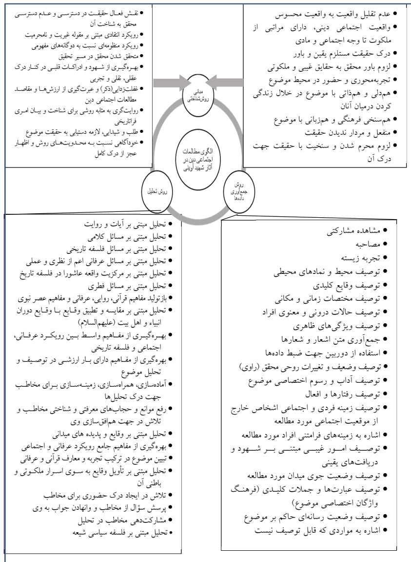
شکل (۱): الگوی نظری حاصل از کدگذاری محوری

در ادامه الگوی مستخرج از کدگذاری محوری آورده می‌شود.